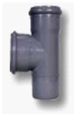
TÊ 90° TD CÓDIGO: 102 45 600