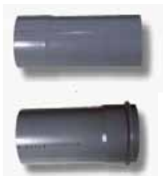
TUBO PRESSÃO COLAR/J.AUT. CÓDIGO: 102 41 100