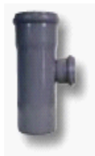
TÊ RED. 90° TD CÓDIGO: 102 43 100