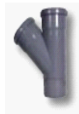
FORQUILHA RED. 45° TD CÓDIGO: 102 42 900