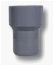
CALÇÃO 90 SANITA DIREITO CÓDIGO: 102 44 610