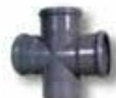
TÊ DUPLO 90° TD CÓDIGO: 102 45 750