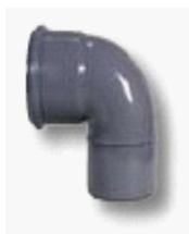
CURVA 90° TD CÓDIGO: 102 42 400