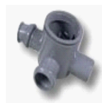
SIFÃO PAVIMENTO 110 CÓDIGO: 102 44 200