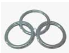
ARO LARGO CROMADO CÓDIGO: 102 44 951