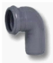
CURVA REDUÇÃO 90° TD CÓDIGO: 102 42 450