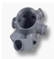
SIFÃO PAVIMENTO 125 CÓDIGO: 102 44 300