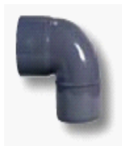
CURVA 90° TU CÓDIGO: 102 43 700