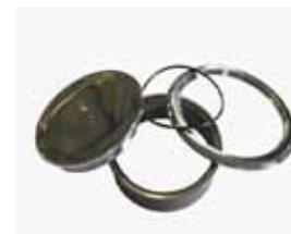
KIT VEDAÇÃO P/TUBO SÉRIE B CÓDIGO: 102 45 400