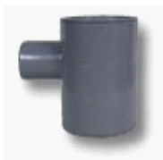
SIFÃO PAV. 90 C/1 SAÍDA 40 CÓDIGO: 102 44 500