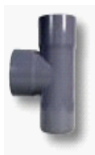
TÊ 90° TU CÓDIGO: 102 43 900