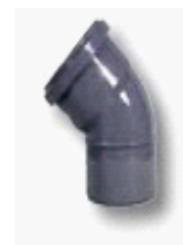
CURVA 45° TD CÓDIGO: 102 42 300