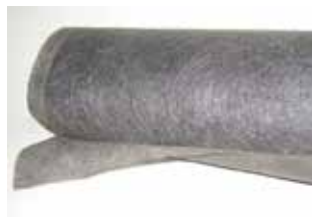
MANTA GEOTÊXTIL CÓDIGO: 102 48 180