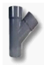
FORQUILHA 45° TU CÓDIGO: 102 43 800