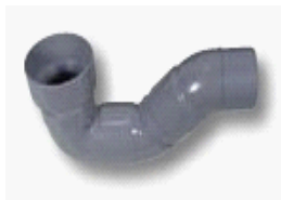
SIFÃO PIA CÓDIGO: 102 44 510