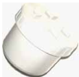
TAMPÃO VISITA ROSCADO CÓDIGO: 102 45 250