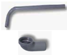
BENGALA / CURVA ROSCADA CÓDIGO: 102 44 700