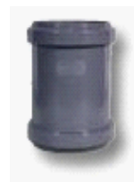
UNIÃO TD CÓDIGO: 102 43 500