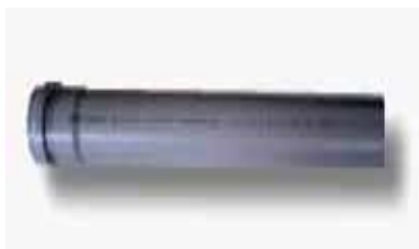
TUBO SN2 - 3KKK CÓDIGO: 102 40 700