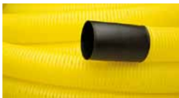
TUBO DRENAGEM S/FILTRO CÓDIGO: 102 48 100