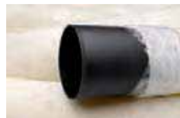
TUBO DRENAGEM C/FILTRO CÓDIGO: 102 48 150