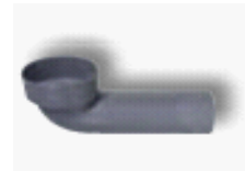
CURVA 90 SANITA CÓDIGO: 102 44 600