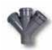
FORQ. DUPLA RED. 45° TD CÓDIGO: 102 42 800