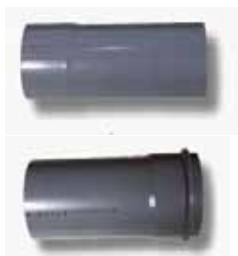
TUBO SÉRIE B COLAR/ORING CÓDIGO: 102 40 400