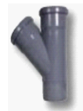
FORQUILHA 45° TD CÓDIGO: 102 42 500