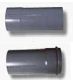
TUBO 3KKK COLAR/ORING CÓDIGO: 102 40 501