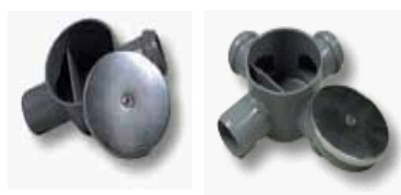
SIFÃO PAVIMENTO 90 CÓDIGO: 102 44 100