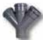
FORQUILHA DUPLA 45° TD CÓDIGO: 102 45 700