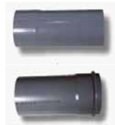
TUBO PN2,5 COLAR/PN4 ORING CÓDIGO: 102 40 604