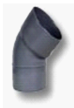
CURVA 45° TU CÓDIGO: 102 43 600