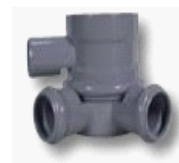
SIFÃO PAV. ORIENTÁVEL CÓDIGO: 102 44 400