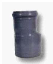
REDUÇÃO EXCÊNTRICA TD CÓDIGO: 102 43 400